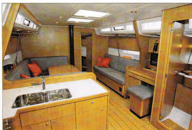
▲ Le design est soigné, à l'image de ces grandes lattes pour le plancher.

en teck, une vraie réussite. Les emménagements sont également chics et bien pensés même si les mains courantes brillent par leur absence. L'ensemble est sobre et clair et l'emplacement des hublots de coque est pertinent. Mais même si le style est réussi, à l'image du biseau qui caractérise l'angle supérieur du rouf, ce sont ses performances, tout à fait exceptionnelles, qui ont remporté l'adhésion du jury. Le Grand Soleil 50 va vite, très vite même, sans jamais donner à son équipage l'impression de forcer ou d'être à la limite. Le signe d'une carène réussie mais aussi d'un accastillage bien dimensionné et bien disposé. Ajoutons que ces grandes surfaces de pont sont idéales pour y installer des matelas au soleil!