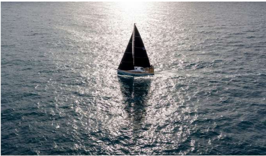
Il Grand Soleil 44 Essentia è il nuovo campione del mondo ORC