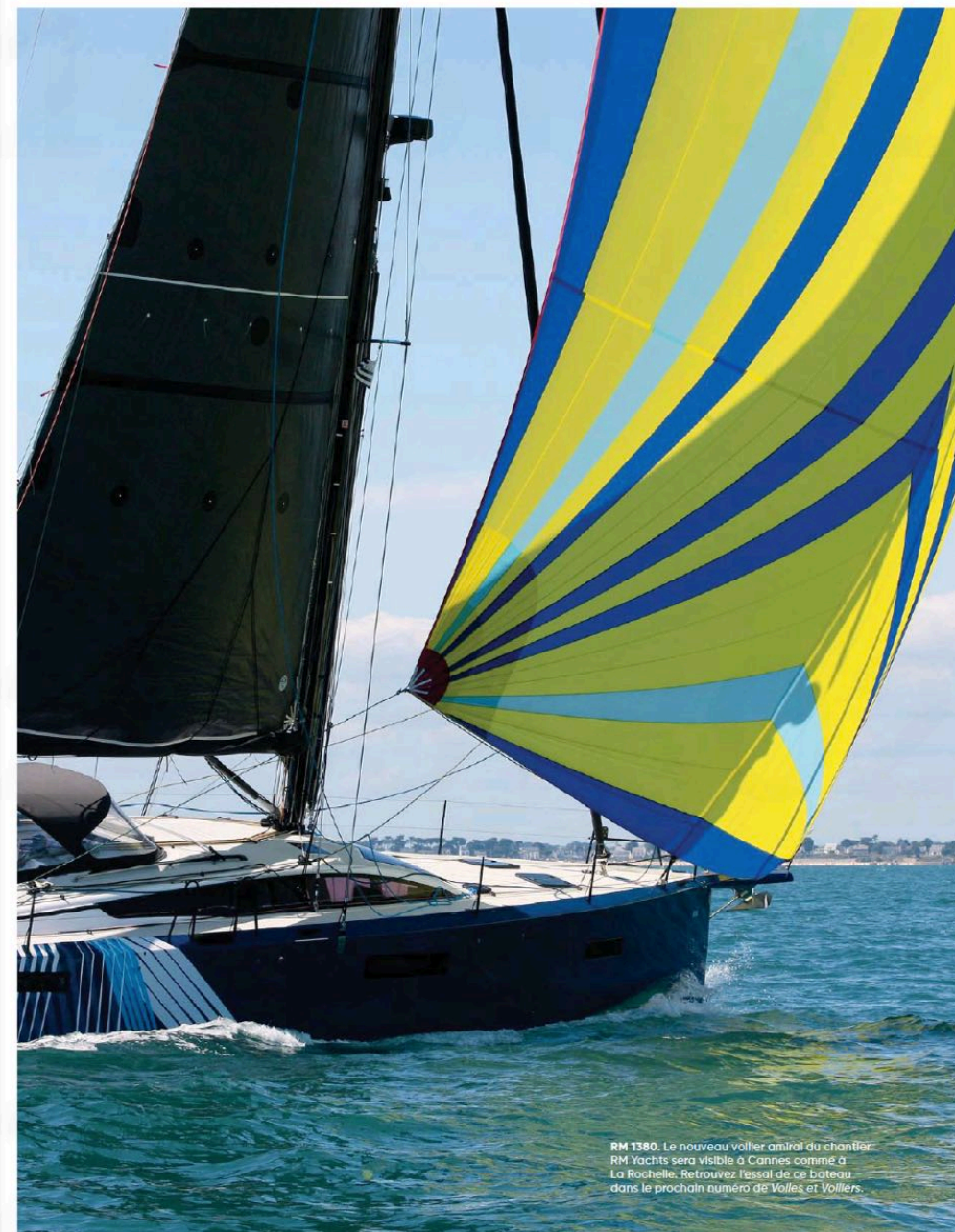
RM 1380. Le nouveau voilier amiral du chantier. RM Yachts sera visible à Cannes comme à La Rochelle. Retrouvez l'essai de ce bateau dans le prochain numéro de Voiles et Voiliers .