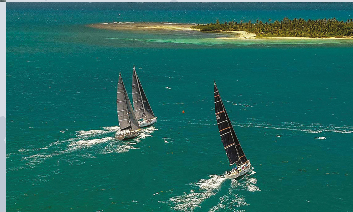
GRAND SOLEIL CUP - PUERTO RICO