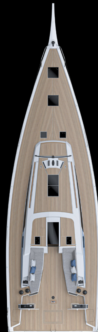
Top View GS 52 PERFORMANCE