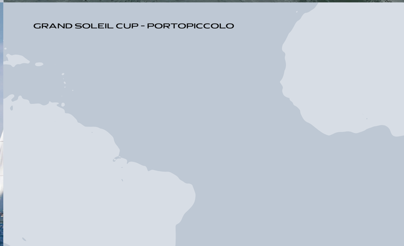
GRAND SOLEIL CUP - PORTOPICCOLO