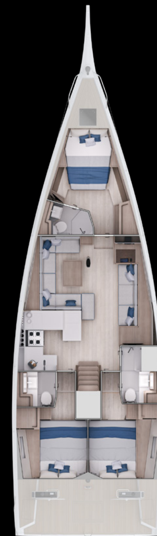
Interior View Std. GS 52 PERFORMANCE