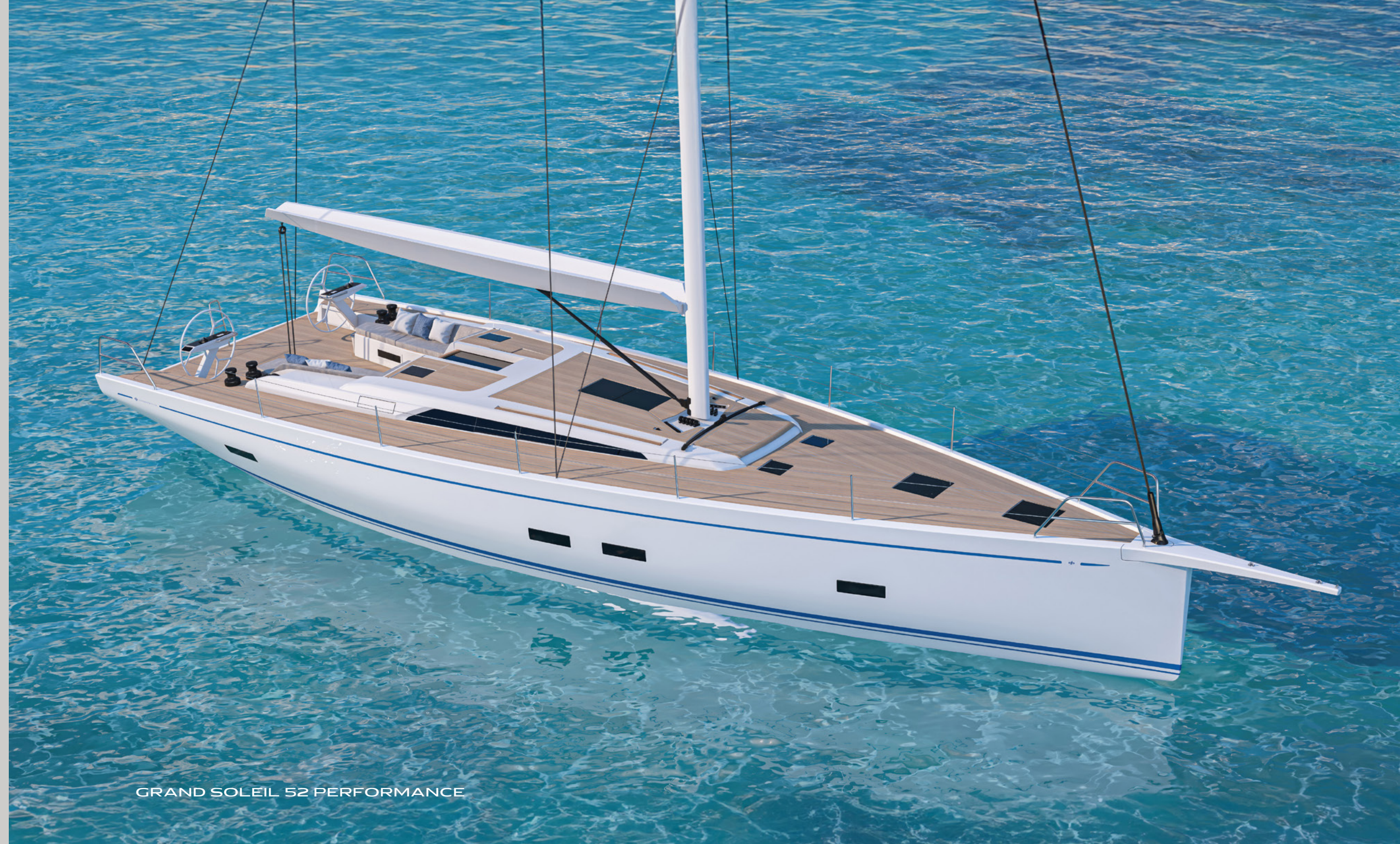
GRAND SOLEIL 52 PERFORMANCE