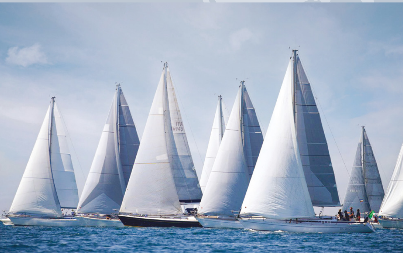
GRAND SOLEIL VINTAGE CUP - PORTOPICCOLO