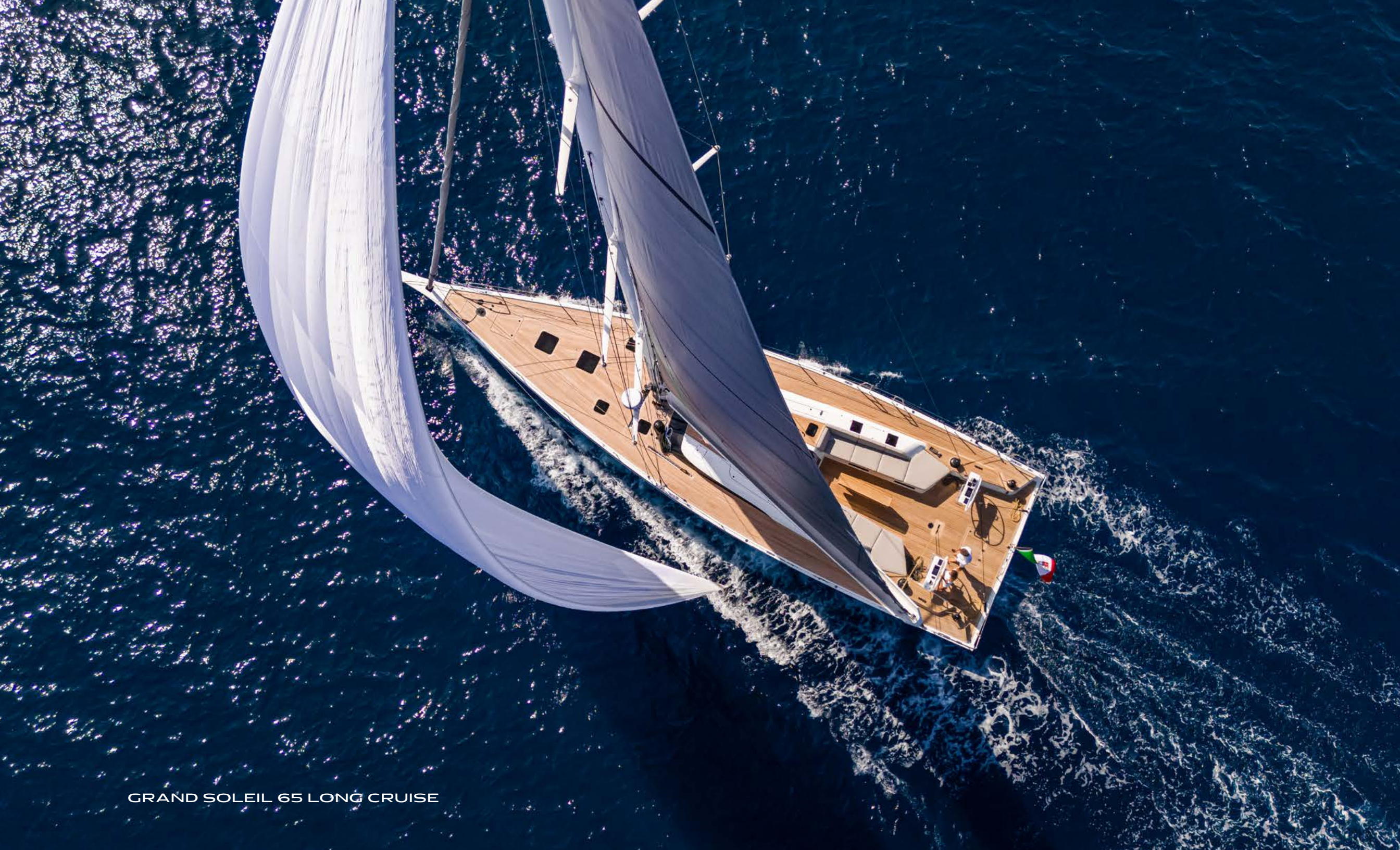
GRAND SOLEIL 65 LONG CRUISE