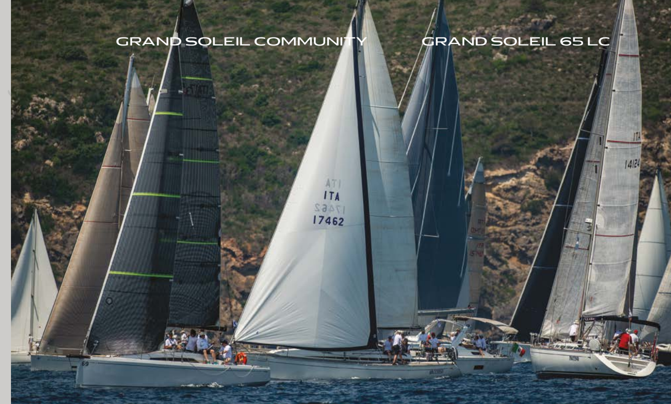
GRAND SOLEIL COMMUNITY