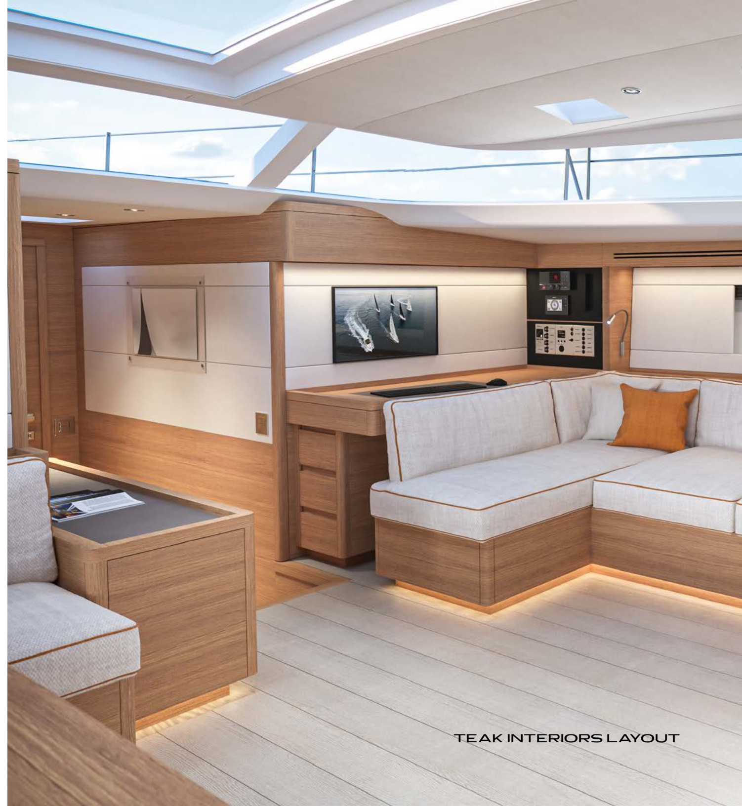
TEAK INTERIORS LAYOUT

Il design e le varie palette dei materiali connotano gli interni di uno stile sobrio, fresco, elegante ed accogliente. Gli interni sono disponibili con finiture in teak, noce o rovere, lasciando all'armatore ampia scelta di personalizzazione.