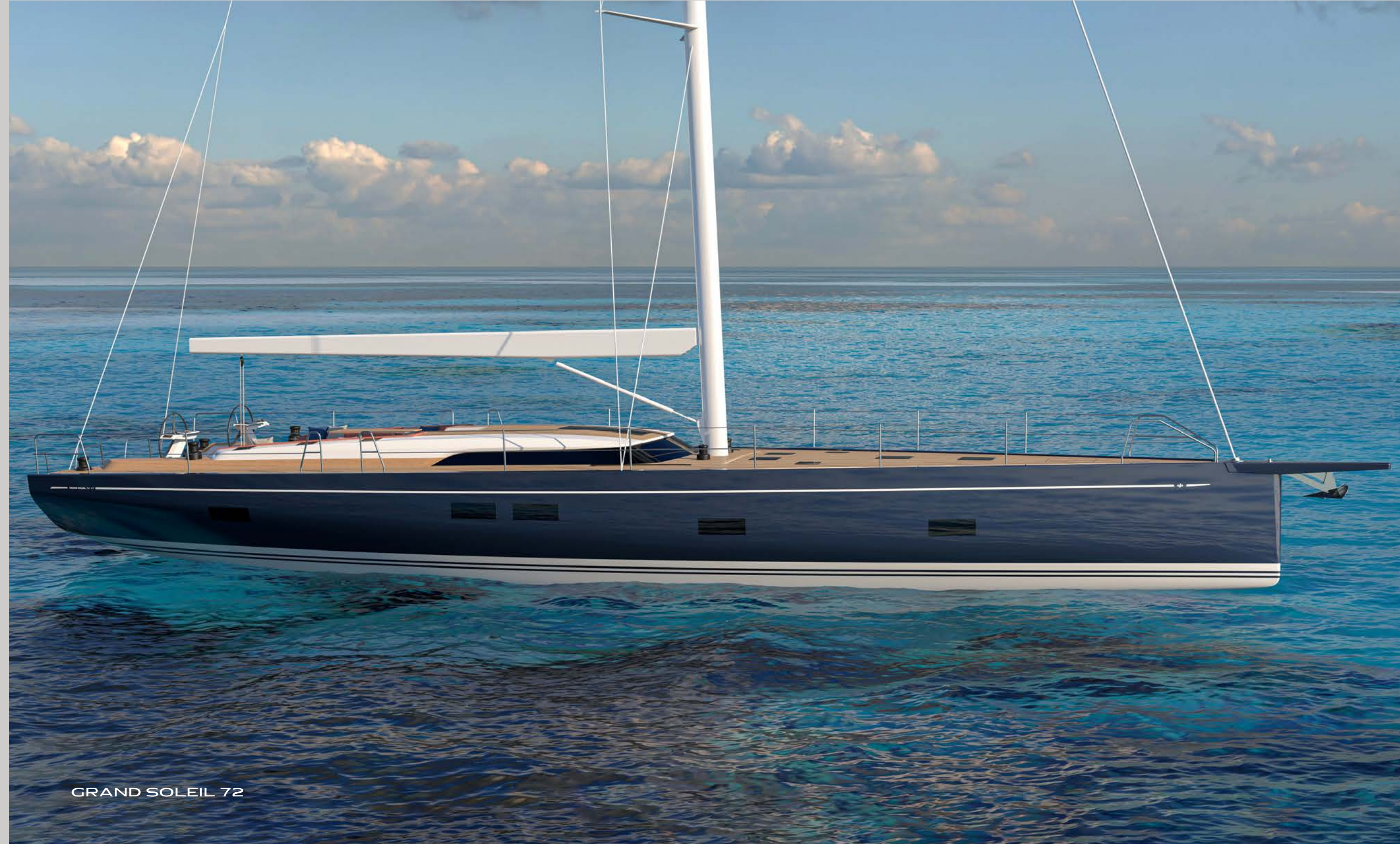
GRAND SOLEIL 72