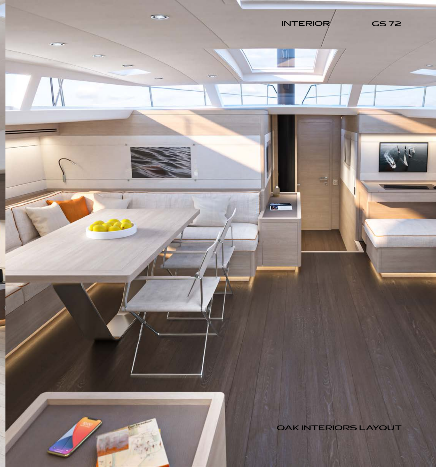
OAK INTERIORS LAYOUT