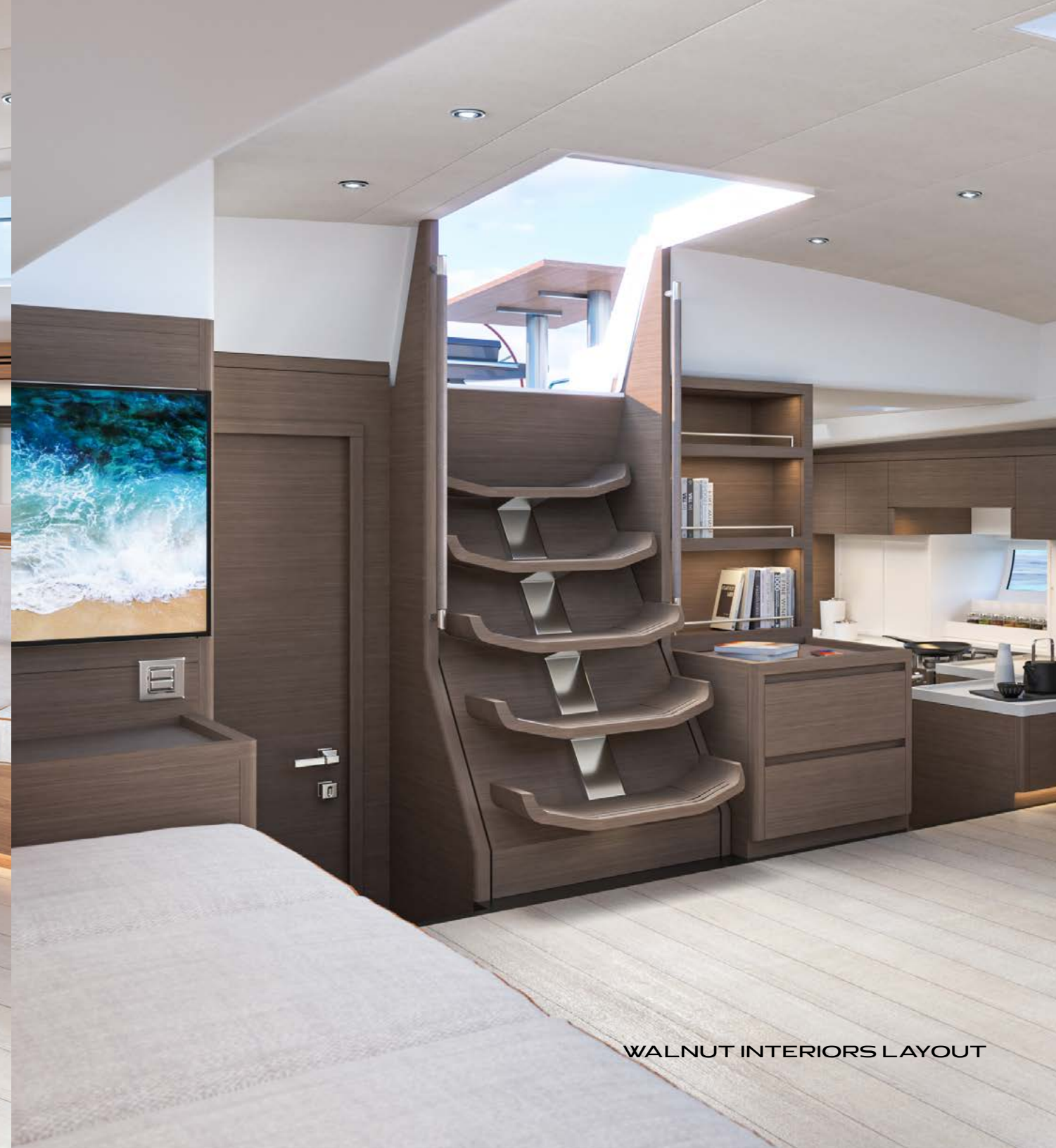
WALNUT INTERIORS LAYOUT