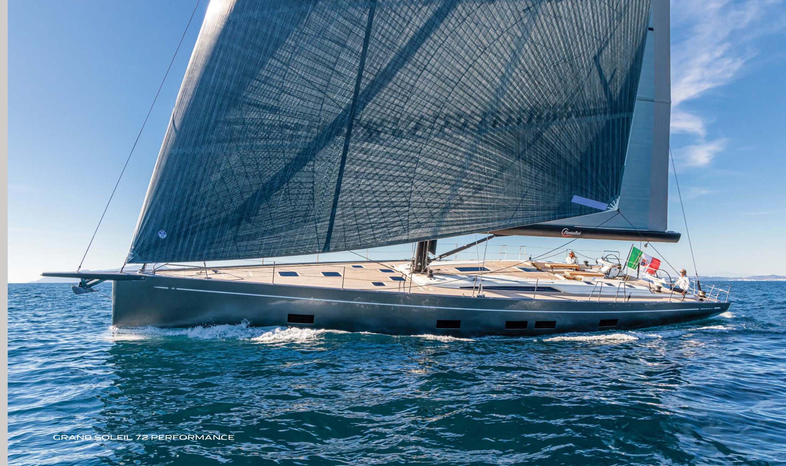
GRAND SOLEIL 72 PERFORMANCE