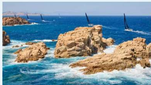
I colori inconfondibili della Costa Smeralda, nel 2024 teatro della Maxi Yacht Rolex Cup n. 34

20 Marzo 2024 | Aggiornato 21 Marzo 2024 alle 10:59 | 2 minuti di lettura