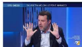
Scintille in tv tra Gruber e Salvini: "Qui si fanno domande", "Siete faziosi"