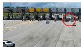
Rosignano: l'incidente al casello ripreso dalle telecamere